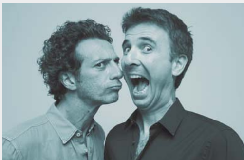
FIGARRA E PICONE